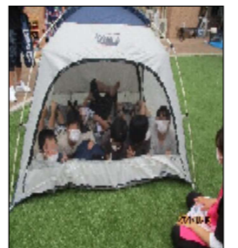
皆でテントをはりました！

【職員の感想】 夏休みの行事がなくなり残念がっていましたが、中庭でキャンプをする事が出来て、子ども達は楽しんで参加する事が出来ていたため良かったです。雨の中、予定を変更する場面もありましたが、工夫して進める事が出来、子ども達の笑顔も沢山見られ、皆とても喜んでいました。天候面の心配もありましたが、雨に見舞われる事もなく、無事にパーベキューも夜の散歩・ミニ運動会も行いう事が出来、子ども達は全員喜んでいました。他のユニットの子ども同士で遊んだり、ゲームをして、嬉しそうに楽しそうに関わっている様子が、とても微笑ましく感じました。