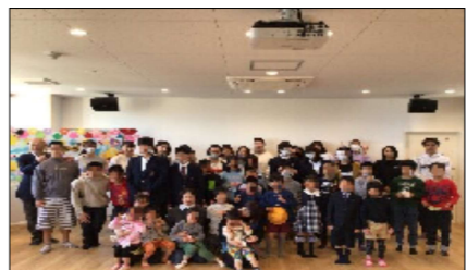
お祝い会後に全員での記念撮影

【子ども達の感想】 皆からお祝いをされて、少し恥ずかしかったけど、とても楽しかった。緊張したけど、高校生になれたと実感しました。久しぶりにみんなで昼食を食べる事が出来て楽しかったです。