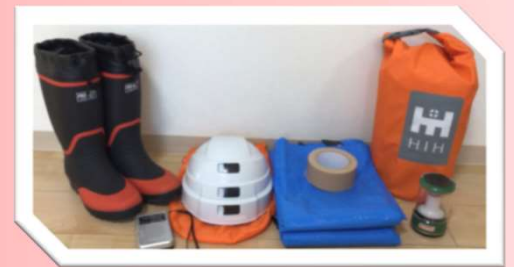
【災害時迅速に避難するため各ユニットに防災キットを配置】