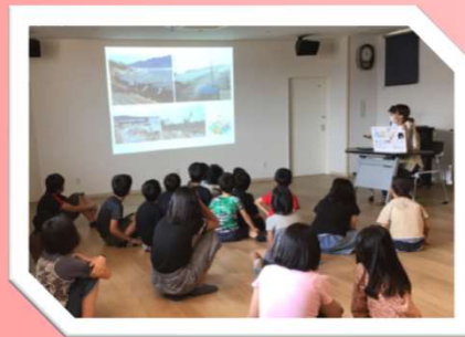
【地震災害について子ども達は真剣に話を聞いていた】